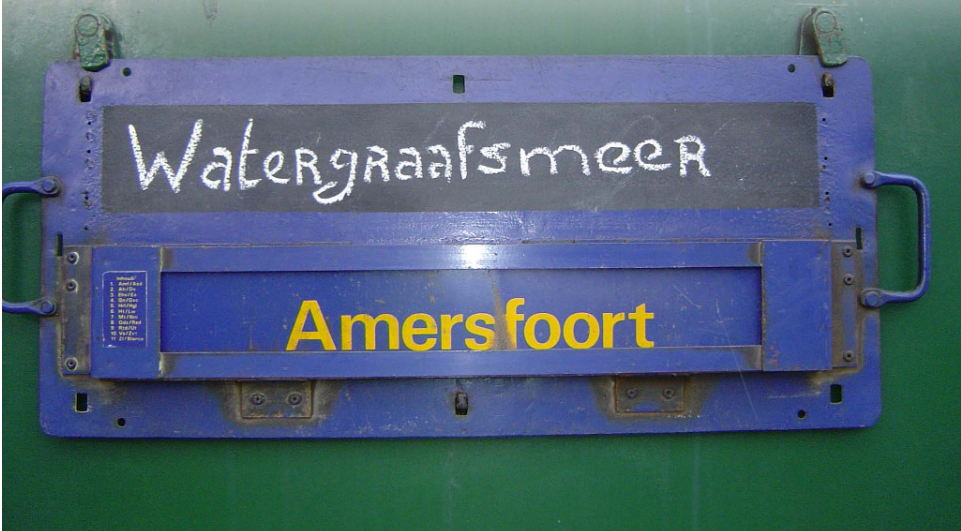
Het speciaal vervaardigde koersbord waarmee de 766 naar Amersfoort reed.

Op donderdag 26 januari vond de overbrenging van de trein plaats van de Watergraafsmeer naar onze nieuwe thuishaven Amersfoort Bokkeduinen. Deze rit was tevens een afscheidsrit van een medewerkster van NS. De bedoeling was dat de trein om 13:00 uur onder de rijdraad gezet zou worden, maar door drukte op de Watergraafsmeer ging dit niet. We kregen te horen dat de late dienst (die om 15:00 uur begint) het zou gaan doen. Toen we om ongeveer 15:15 uur nog eens gingen informeren hoe laat we